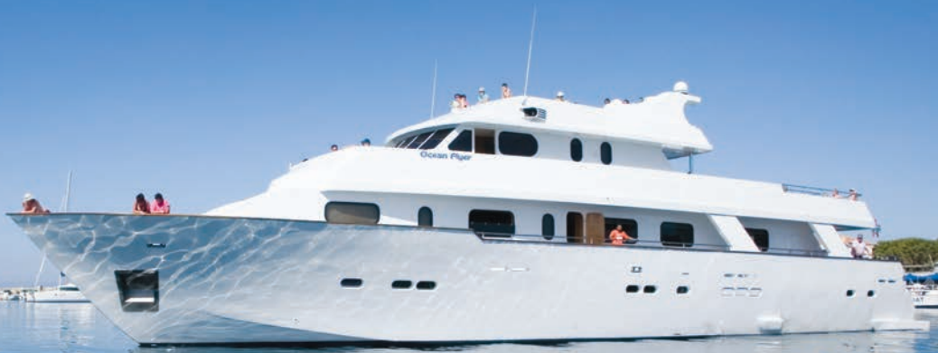
OCEAN FLYER All Inclusive Cruises